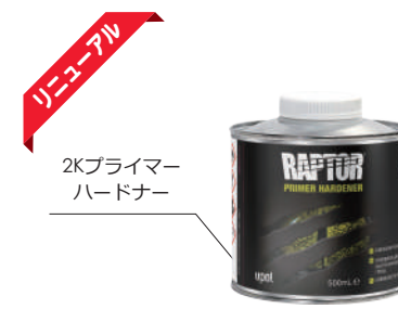
2Kプライマー ハードナー

▶ラプターの保護塗料性と耐腐食性をさらに強化します。 ▶腐食防止添加剤の配合で錆や腐食を抑制し、塩水噴霧にも強いので塗料が長持ちします。