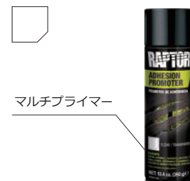
マルチプライマー

▶素地のエッチングと下塗りをワンステップで実現します。 ▶リン酸エステル配合により、亜鉛メッキ鋼やアルミニウムのような難しい材質への塗料の接着を促進します。